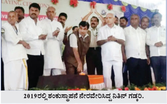
2019ರಲ್ಲಿ ಶಂಕುಸ್ಥಾಪನೆ ನೇರವೇರಿಸಿದ್ದ ನಿತಿನ್ ಗಡ್ಕರಿ.

ಶಿವಮೊಗ್ಗ: ಶರಾವತಿ ಹಿನ್ನೀರು ಭಾಗದ ಜನರ 60 ವರ್ಷದ ಕನಸು ನನಸಾಗಿದೆ. ದೇಶದ ಎರಡನೇ ಅತಿ ಉದ್ದದ ಕೇಬಲ್ ಸೇತುವೆ ಸಿಗಂದೂರು ಬ್ರಿಡ್ಜ್ ಕಾಮಗಾರಿ ಪೂರ್ಣವಾಗಿದ್ದು ಇಂದು ಲೋಕಾರ್ಪಣೆಯಾಗಲಿದೆ. 2019ರಲ್ಲಿ ಸೇತುವೆ ನಿರ್ಮಾಣಕ್ಕೆ ಗುಡ್ಡಲಿ ಪೂಜೆ ಮಾಡಿದ್ದ ಕೇಂದ್ರ ಭೂ ಸಾರಿಗೆ ಸಚಿವ ನಿತಿನ್ ಗಡ್ಕರಿ ಅವರೇ ಈ ಸೇತುವೆಯನ್ನು ಲೋಕಾರ್ಪಣೆ ಮಾಡಲಿದ್ದಾರೆ. ನಾಗ್ಪುರದಿಂದ ವಿಶೇಷ ವಿಮಾನದ ಮೂಲಕ ಬೆಳಿಗ್ಗೆ 10:45ಕ್ಕೆ ಶಿವಮೊಗ್ಗ ವಿಮಾನ ನಿಲ್ದಾಣಕ್ಕೆ ಗಡ್ಕರಿ ಬರಲಿದ್ದಾರೆ. ಬಳಿಕ ಹೆಲಿಕಾಪ್ಟರ್‌ನಲ್ಲಿ ಸಾಗರದ ಮಂಕಳಲೆ ಹೆಲಿಪ್ಲಾಡಿಗೆ ಬಂಧು ಅಲ್ಲಿಂದ ರಸ್ತೆ ಮಾರ್ಗದ ಮೂಲಕ ಸಿಗಂದೂರು ಸೇತುವೆ ಬಳಿ ಬರಲಿದ್ದಾರೆ. ಮಧ್ಯಾಹ್ನ 12 ಗಂಟೆಗೆ ಐತಿಹಾಸಿಕ ಸೇತುವೆ ಉದ್ಘಾಟನೆಯಾಗಲಿದ್ದು ಬಳಿಕ 12:40ಕ್ಕೆ ಸಿಗಂದೂರು ಚೌಡೇಶ್ವರಿ ದೇವಾಲಯಕ್ಕೆ ಭೇಟಿ ನೀಡಲಿದ್ದಾರೆ. ಮಧ್ಯಾಹ್ನ 2 ಗಂಟೆಗೆ ಸಾಗರದ ನೆಹರೂ ಮೈದಾನದಲ್ಲಿ ಸಭಾ ಕಾರ್ಯಕ್ರಮದಲ್ಲಿ ಗಡ್ಕರಿ ಭಾಗಿಯಾಗಲಿದ್ದಾರೆ. ಸೇತುವೆ ಲೋಕಾರ್ಪಣೆ ಜೊತೆಗೆ ರಾಜ್ಯದ 2,056 ಕೋಟಿ ರೂ. ವೆಚ್ಚದ ವಿವಿಧ ಯೋಜನೆಗಳಿಗೆ ನಿತಿನ್ ಗಡ್ಕರಿ ಚಾಲನೆ ಹಾಗೂ ಶಂಕುಸ್ಥಾಪನೆ ಮಾಡಲಿದ್ದಾರೆ. ಈ ಕಾರ್ಯಕ್ರಮದಲ್ಲಿ ಕೇಂದ್ರ ಸಚಿವ ಪ್ರಹ್ಲಾದ್ ಜೋಷಿ, ಮಾಜಿ ಸಿಎಂ ಬಿ.ಎಸ್. ಯಡಿಯೂರಪ್ಪ, ಸಂಸದ ರಾಘವೇಂದ್ರ ಸೇರಿದಂತೆ ಹಲವರು ಭಾಗಿಯಾಗಲಿದ್ದಾರೆ. ಸಭಾ ಕಾರ್ಯಕ್ರಮದ ಬಳಿಕ ಬಳಿಕ ಶಿವಮೊಗ್ಗ ವಿಮಾನ ನಿಲ್ದಾಣಕ್ಕೆ ತೆರಳಿ ಅಲ್ಲಿಂದ ದೆಹಲಿಗೆ ಗಡ್ಕರಿ ಪ್ರಯಾಣ ಬೆಳೆಸಲಿದ್ದಾರೆ.