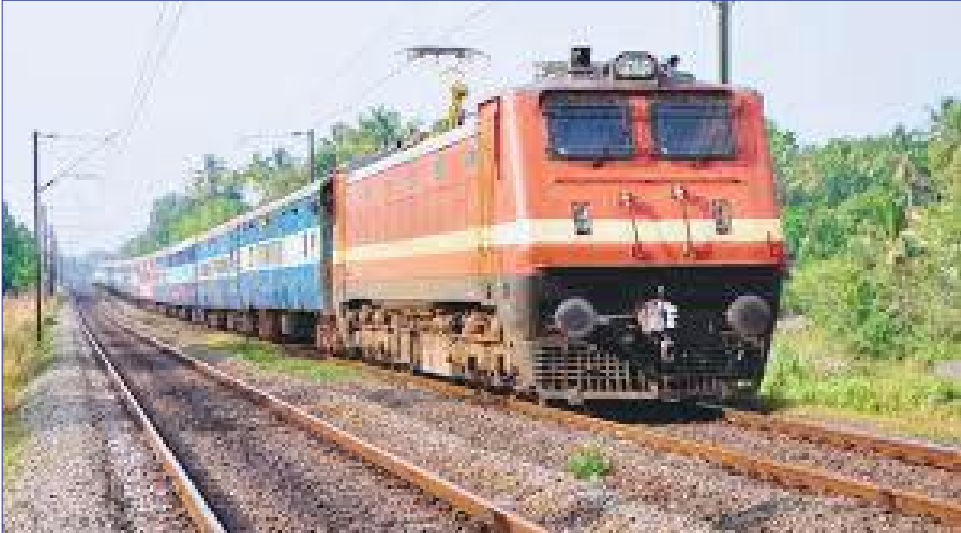
ಈ ರೈಲುಗಳು ಎರಡು ಎ.ಸಿ. 2- ಟೈರ್, ಆರ್.ಎ.ಸಿ. 3-ಟೈರ್, ಏಕು ಸ್ಲೀಪರ್ ಕ್ಲಾಸ್, ನಾಲ್ಕು ಜನರಲ್ ಸೆಕೆಂಡ್ ಕ್ಲಾಸ್, ಒಂದು ಲಗೇಜ್ ಕಮ್ ಜನರೇಟರ್ ಕಾರ್ ಮತ್ತು ಒಂದು ಎಸ್.ಎಲ್.ಆರ್.ಡಿ. ಬೋಗಿಗಳನ್ನು ಹೊಂದಿರಲಿದೆ. ರೈಲು ಸಂಖ್ಯೆ. 07069 ಹೈದರಾಬಾದ್ - ಆರಸೀಕೆರೆ ವಿಶೇಷ ರೈಲು 2025ರ ಜುಲೈ 08 ರಿಂದ 2025 ರ ಆಗಸ್ಟ್

ಚಿಕ್ಕಬಳ್ಳಾಪುರ: ಕರ್ನಾಟಕ ರಾಜ್ಯ ಮುಕ್ತ ವಿಶ್ವವಿದ್ಯಾನಿಲಯ ಮುಕ್ತ ಗಂಗೋತ್ರಿ ಮೈಸೂರು ಪ್ರಾದೇಶಿಕ ಕೇಂದ್ರ ಚಿಕ್ಕಬಳ್ಳಾಪುರದಲ್ಲಿ ಸ್ನಾತಕ ಹಾಗೂ ಸ್ನಾತಕೋತ್ತರ ಕೋರ್ಸ್‌ಗಳಾದ ಬಿ.ಎ., ಬಿ.ಕಾಂ., ಬಿ.ಬಿ.ಎ., ಬಿ.ಸಿ.ಎ., ಬಿ.ಎಲ್ .ಐ.ಎಸ್.ಸಿ., ಬಿ.ಎಸ್.ಸಿ., ಎಂ.ಎ., ಎಂ.ಎ.ಸಿ., ಎಂ.ಸಿ.ಎಂ., ಎಂ.ಕಾಂ., ಎಂ.ಎಲ್.ಎಂ.ಎಲ್.ಸಿ., ಬಿ.ಎಸ್.ಡಬ್ಲ್ಯೂ., ಎಂ.ಎಸ್.ಡಬ್ಲ್ಯೂ ಮತ್ತು ಪಿ.ಜೆ. ಡಿಪ್ಲೊಮಾ ಸರ್ಟಿಫಿಕೇಟ್ ಪ್ರೊಗ್ರಾಂಗಳಿಗೆ ಪ್ರವೇಶಾತಿ ಪ್ರಾರಂಭವಾಗಿದೆ. ಯು.ಜಿ.ಸಿ. ನಿವೇದನವೇ ಪ್ರಕಾರ ಹಾಗೂ ಒಪ್ಪಿತ ಯೂನಿವರ್ಸಿಟಿಯಲ್ಲಿ ಪಡೆಯುವ ಶಿಕ್ಷಣಗಳೆರಡು ಒಂದೇ ಸಮಾನದ ಆವಕತೆ ಹೊಂದಿರುತ್ತದೆ. ಮಾಹಿತಿಗೆ ಎಂ.ಜಿ. ರಸ್ತೆ ಚಿಕ್ಕಬಳ್ಳಾಪುರ ದೂರದೂರ ಕೆಂಂಖ್ಯೆ:9164300299, 9448860885, 6361508766, 7353789129ಗೆ ಸಂಪರ್ಕಿಸಿ.