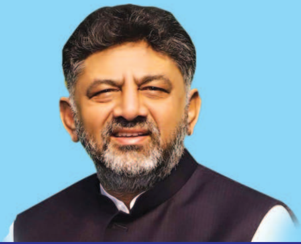
ಶ್ರೀ ಡಿ.ಕೆ. ಶಿವಕುಮಾರ್ ಮಾನ್ಯ ಉಪ ಮುಖ್ಯಮಂತ್ರಿಗಳು ಹಾಗೂ ಬೆಂಗಳೂರು ನಗರಾಭಿವೃದ್ಧಿ ಸಚಿವರು ಕರ್ನಾಟಕ ಸರ್ಕಾರ