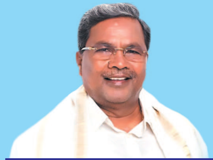
ಶ್ರೀ ಸಿದ್ದರಾಮಯ್ಯ ಸನ್ಮಾನ್ಯ ಮುಖ್ಯಮಂತ್ರಿಗಳು ಕರ್ನಾಟಕ ಸರ್ಕಾರ