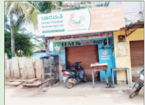
ವಿಜಯಪುರ ಪಟ್ಟಣದಲ್ಲಿ ವಿಶ್ವಗುರು ಬಸವಣ್ಣನವರ ಬಸವ ಜಯಂತಿ ಹಬ್ಬದ ಪ್ರಯುಕ್ತ ಪಟ್ಟಣದಾದ್ಯಂತ ಮಾಂಸದಂಗಡಗಳು ಮುಚ್ಚಿದ್ದು ಕಂಡುಬಂದಿತು