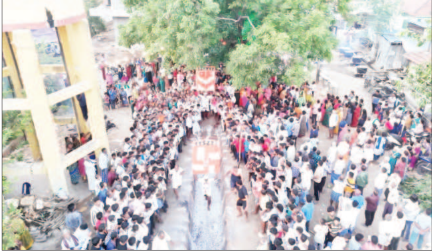
ವಿಜೃಂಭಣೆಯಿಂದ ನಡೆದ ಕೊಂಡೋತ್ಸವ ಮಂಡ್ಯ ತಾಲೂಕಿನ ಕಾರಸವಾಡಿ ಗ್ರಾಮದ ಬೈರವೇಶ್ವರ ಸ್ವಾಮಿಯ ಹಬ್ಬದ ಅಂಗವಾಗಿ ಕ್ಯಾಪ್ಟನ್ ಮಂಚಮ್ ಬಂಡಿ ಉತ್ಸವ ವಿಜೃಂಭಣೆಯಿಂದ ನಡೆಯಿತು. ಎರಡು ದಿನಗಳ ಕಾಲ ಗ್ರಾಮದಲ್ಲಿ ವಿಜೃಂಭಣೆಯಿಂದ ಹಬ್ಬ ನಡೆಯಿತು. ಹಬ್ಬದ ಅಂಗವಾಗಿ ಕ್ಯಾಪ್ಟನ್ ಮತ್ತು ಮಂಚಮ್ ದೇವಿಯ ಪೂಜೆಗಳ ಮೆರವಣಿಗೆ ನಡೆಯಿತು. ನಂತರ ಕೊಂಡೋತ್ಸವ ನಡೆಯಿತು.