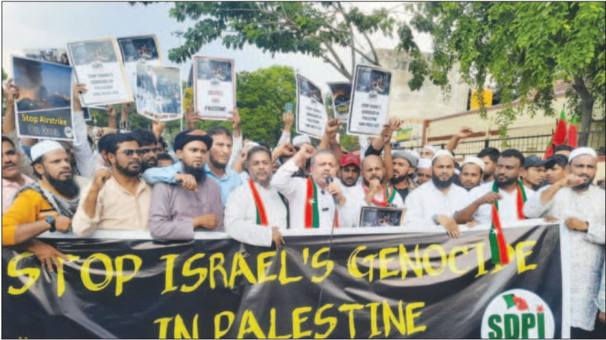
ಪ್ಯಾಲೆಸ್ಟೀನ್ ಮೇಲೆ ಇಸ್ರೇಲ್ ನಡೆಸುತ್ತಿರುವ ದಾಳಿ ಖಂಡಿಸಿ ಎಸ್‌ಡಿಪಿಐ ವತಿಯಿಂದ ಶನಿವಾರ ಪ್ರತಿಭಟನೆ ನಡೆಸಲಾಯಿತು.

ಸ್ವಾಲ್ಪೀನರು: ಪ್ರಾಲ್ಪೀನ ಗುಂಪಿಯಾಗಿ ಇತ್ತೀಚೆಗೆ ಹೆಸರು ಪಡೆದ ದಾಳಿ ಯನ್ನು ಬಿಂಡಿ ಎಸೆದಿರುವ ಬೃಹತ್ ಸಂಘಟನೆ ನಡೆಸಲಾಯಿತು. ಮೈಸೂರಿನ ಸುತ್ತ ಫಿಲೀಪಿನಾ ಚರ್ಚೆ ಎದುರಿಸುವ ಮದ್ಯಾಹ್ನ ಜಮಾಯಿ ಸಿದ್ಧ ಎಸೆದಿರುವ ರಾಯಚೂರಿನ ಇತ್ತೀಚೆಗೆ ವಿರುದ್ಧ ಘೋಷಣೆ ಕೂಗಿ ಅಕ್ರೂರ ವ್ಯಕ್ತಪಡಿಸಿದರು. ಈ ವೇಳೆ, ಇತ್ತೀಚೆಗೆ ಹೊಸದೊಡ್ಡ ಕ್ಷುಲ್ಕ ಎದುರಿಸಿ ಮಹಿಳೆ ಮಾಡಿ, ಇತ್ತೀಚೆಗೆ ದಾಳಿ ನಡೆಸಿ ಸುಮಾರು 500ಕ್ಕೂ ಹೆಚ್ಚು ಜನರನ್ನು ಕೊಂದಿದ್ದಾರೆ. ಇದರಲ್ಲಿ 200ಕ್ಕೂ ಹೆಚ್ಚು ಮಕ್ಕಳು ಮೃತರಾಗಿದ್ದಾರೆ. ಆಮೆರಿಕಾ ಪರೋಕ್ಷವಾಗಿ ಜನಾಂಗೀಯ ಕುರುಹಾಗಿದೆ ಎಂದು ಕೆಲ ಕಾರಿದರು. ಮುಸ್ಲಿಂ ಸಂಪ್ರದಾಯಕ್ಕೆ ಜೊಳ್ಳಿ ಸೇರಿದಂತೆ ★ ಇಡೀ ಜಗತ್ತು ಇತ್ತೀಚೆಗೆ ಈ ಆಮಾನ ವೀಯ ಹತ್ಯಾಕಾಂಡವನ್ನು ನೋಡಬೇಕೆಂಬ ಇಚ್ಛೆಯಿಂದ ಆಫ್ರಿಕಾಕೂ ಬಂದವರು ಸುಮಾರು 0 ಸಾವಿರ ಪ್ರಾಲ್ಪೀನರು ಹೆಸರಾಗಿದ್ದಾರೆ. ಇದರಲ್ಲಿ ಸುಮಾರು 0 ಮಕ್ಕಳು ಸಾವನ್ನಪ್ಪಿರುವುದು ಅತ್ಯಂತ ದುಃಖಕರವಾಗಿದೆ. ನಾವು ಪ್ರಾಲ್ಪೀನ ಜನತೆಗೆ ಸುಮಾರು ದೃಷ್ಟಿಯಿಂದ ಬೆಂಬಲ ನೀಡಬೇಕೆಂದು ಕೋರಿದೆ.