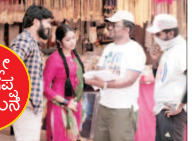
ಎಲ್ಲೋ ಜೋಗಪ್ಪ ನಿನ್ನರಮನೆ