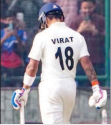
ಎದುರು ನೋಡುತ್ತಿದ್ದರು. ಆದರೆ ಕೊಹ್ಲಿ ಎಲ್ಲರನ್ನೂ ತಣ್ಣಗೆ ಮಾಡಿದರು.

ನವದೆಹಲಿ: ಸುಮಾರು 12 ವರ್ಷಗಳ ನಂತರ ರಣಜಿ ಟೋಫಿ ಪಂದ್ಯದಲ್ಲಿ ಕಾಣಿಸಿಕೊಂಡು ಸಾಮಾನ್ಯರೂ ಪ್ರೇಕ್ಷಕರ ಅರ್ಪಣೆಯಾಗಿದ್ದ ರನ್ ಮಿಷನ್ ವಿರಾಟ್ ಕೊಹ್ಲಿ, ರೈಲ್ವೆ ಎದುರಿದ್ದ ಪಂದ್ಯದಲ್ಲಿ ಕೇವಲ 6 ರನ್ ಗಳಿಸುವ ಮೂಲಕ ನಿರಾಸೆ ಮೂಡಿಸಿದರು.