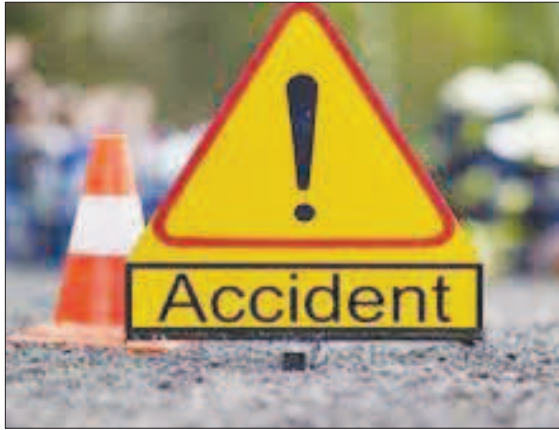
ಮೇಳದಲ್ಲಿ ಪವಿತ್ರ ಸ್ನಾನ ಮುಗಿಸಿ ಮರಳುತ್ತಿದ್ದರು. ಈ ವೇಳೆ, ವಾಹನದ ಆಕ್ಸೆಲ್ ಕಟ್ಟಾಗಿದ್ದು, ಹಿಂದಿನಿಂದ ಮಹಾಕುಂಭ

ಗಾಜಿಪುರ್: ಮಹಾಕುಂಭ ಮೇಳದಿಂದ ವಾಪಸ್ ಆಗುತ್ತಿದ್ದ ಯಾತ್ರಾರ್ಥಿಗಳಿದ್ದ ಪಿಕಪ್ ವಾಹನ ಅಪಘಾತಕ್ಕೆ ಒಳಗಾಗಿದ್ದು, 8 ಮಂದಿ ಸ್ಥಳದಲ್ಲೇ ಸಾವನ್ನಪ್ಪಿದ್ದು, 12 ಮಂದಿ ಗಾಯಗೊಂಡಿದ್ದಾರೆ ಎಂದು ಉತ್ತರ ಪ್ರದೇಶ ಪೊಲೀಸರು ಮಾಹಿತಿ ನೀಡಿದ್ದಾರೆ.