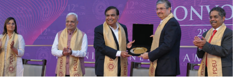
ವಿಶ್ವವಿದ್ಯಾಲಯದಿಂದ ಹೊರಹೋದ ತಕ್ಷಣ, ನೀವು ಇನ್ನೂ ದೊಡ್ಡದಾದ 'ಯೂನಿವರ್ಸಿಟಿ ಆಫ್ ಲೈಫ್' ನಲ್ಲಿ ಪ್ರವೇಶ ಪಡೆಯಬೇಕಾಗುತ್ತದೆ. ಅಲ್ಲಿ ಕ್ಯಾಂಪಸ್ ಇರುವುದಿಲ್ಲ, ತರಗತಿ ಇರುವುದಿಲ್ಲ ಮತ್ತು ಬೋಧನಾ ಶಿಕ್ಷಕರು ಇರುವುದಿಲ್ಲ. ನೀವು ನಮ್ಮ ಸ್ವಂತ ಜೀವನದಲ್ಲಿ ಮುಂದೆ ಸಾಗಲು ಸಾಧ್ಯವಾಗುತ್ತದೆ ಎಂದರು. ಪ್ರಧಾನಿ ನರೇಂದ್ರ ಮೋದಿಯವರನ್ನು ಶ್ಲಾಘಿಸಿದ

'ನಾನು ನಮ್ಮ ಯುವ ವಿದ್ಯಾರ್ಥಿಗಳಿಗೆ ಒಂದು ಸಲಹೆ ನೀಡಲು ಬಯಸುತ್ತೇನೆ. ಕೃತಕ ಬುದ್ಧಿಮತ್ತೆಯನ್ನು ಸಾಧನವಾಗಿ ಬಳಸುವಲ್ಲಿ ಒಬ್ಬರು ಪ್ರವೀಣರಾಗಿರಬೇಕು ಆದರೆ ನಮ್ಮ ಬುದ್ಧಿವಂತಿಕೆಯನ್ನು ಬಳಸುವುದನ್ನು ನಿಲ್ಲಿಸಬೇಡಿ. ನೀವು ಈ