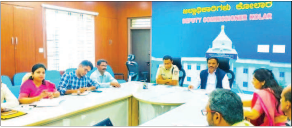
ಕುರಿತು ರೈತರಿಗೆ ಮಾರ್ಗ ದರ್ಶನ ನೀಡಬೇಕು ಎಂದರು. ಅರಿವು ಮೂಡಿಸಬೇಕು. ರೈತರಿಗೆ ಸಂಗ್ರಹಣೆ ಮತ್ತು ಮೌಲ್ಯ ವರ್ಧನೆಯ ಕುರಿತು ಅರಿವು ಮೂಡಿಸಬೇಕು ಹಾಗೂ ರೈತರು

ಇಂದು ಜಿಲ್ಲಾಧಿಕಾರಿ ಕಛೇರಿಯ ಕೆಸ್ಕಾನ್ ಸಭಾಂಗಣದಲ್ಲಿ ಆಯೋಜಿಸಿದ್ದ ಬೆಳೆ ಸಮೀಕ್ಷೆ ಕಾರ್ಯದ ಜಿಲ್ಲಾ ಮಟ್ಟದ ಸಮಿತಿ ಸಭೆಯನ್ನು ದ್ವೇತಿಸಿ ಮಾತನಾಡಿದ ಅವರು, ಕೃಷಿ, ಪಶು ಸಂಗೋಪನೆ, ತೋಟಗಾರಿಕೆ, ಹೈನುಗಾರಿಕೆಗಳನ್ನು ಒಳಗೊಂಡಂತೆ ಸಮಗ್ರ ಕೃಷಿಯನ್ನು ಕೈಗೊಳ್ಳುವ ಮೂಲಕ ಆದಾಯದಲ್ಲಿ ಸುಸ್ಥಿರತೆಯನ್ನು ಕಂಡುಕೊಳ್ಳಲು ಬೆಂಬಲ ನೀಡುವುದು. ಮಣ್ಣಿನ ಗುಣಮಟ್ಟ ಹಾಗೂ ಮಾರುಕಟ್ಟೆ ಬೇಡಿಕೆಯನ್ನು ಆಧರಿಸಿ ಯಾವ ಬೆಳೆ ಬೆಳೆಯ ಬೇಕೆಂಬ