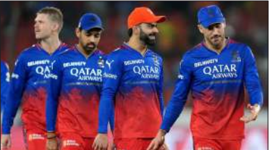
ಎಸ್ ಆರ್ ಹೆಚ್, ಡೆಲ್ಲಿ ಕ್ಯಾಪಿಟಲ್ಸ್ ತಂಡ 10 ಅಂಕಗಳನ್ನು ಹೊಂದಿದೆ. ಆತ್ತ ರಾಜಸ್ಥಾನ್ ರಾಯಲ್ಸ್ 16 ಅಂಕಗಳೊಂದಿಗೆ ಪ್ಲೇಆಫ್ ಪ್ರವೇಶಿಸುವುದನ್ನು ಬಹುತೇಕ ಖಚಿತಪಡಿಸಿಕೊಂಡಿದೆ. ಅಂದರೆ ಇಲ್ಲಿ ಆರ್ ಆರ್ ತಂಡದ ಗೆಲುವು ಮತ್ತು ಸೋಲು ಆರ್ ಸಿಬಿ ತಂಡವನ್ನು ಬಾಧಿಸುವುದಿಲ್ಲ. ಇದಾಗ್ಯೂ ರಾಜಸ್ಥಾನ್ ರಾಯಲ್ಸ್ 20 ಅಂಕಗಳನ್ನು ಪಡೆದರೆ ಆರ್ ಸಿಬಿ ಗೆ ಅನುಕೂಲವಾಗಲಿದೆ. ಹಾಗೆಯೇ ಎಸ್ ಆರ್ ಹೆಚ್ ಮುಂದಿನ ಪಂದ್ಯಗಳನ್ನು ಗೆದ್ದು 20 ಅಂಕಗಳನ್ನು ಪಡೆಯಬೇಕು. ಇನ್ನುಳಿದಂತೆ ಕೆಕೆಆರ್ 16

ಇಂಡಿಯನ್ ಪ್ರೀಮಿಯರ್ ಲೀಗ್ ಸೀಸನ್ 17 ರಲ್ಲಿ ಸೋಲುಗಳಿಂದ ಕಂಗೆಟ್ಟಿದ್ದ ತಂಡವು ಇದೀಗ ಬ್ಯಾಕ್ ಟು ಬ್ಯಾಕ್ ಗೆಲುವು ದಾಖಲಿಸಿದೆ. ಮೊದಲಾರ್ಧದ 7 ಪಂದ್ಯಗಳಲ್ಲಿ ಕೇವಲ 1 ಜಯ ಸಾಧಿಸಿದ್ದ ಆರ್ ಸಿಬಿ, ದ್ವಿತೀಯಾರ್ಧದಲ್ಲಿ 2 ಗೆಲುವು ಸಾಧಿಸಿದೆ. ಈ ಮೂಲಕ ಒಟ್ಟು 6 ಅಂಕಗಳನ್ನು ಕಲೆಹಾಕಿದೆ. ಈ 6 ಅಂಕಗಳೊಂದಿಗೆ ಆರ್ ಸಿಬಿ ತಂಡದ ಪ್ಲೇಆಫ್ ಅಸೆ ಕೂಡ ಜೀವಂತವಾಗಿದೆ. ಅಂದರೆ ಮುಂದಿನ 4 ಪಂದ್ಯಗಳಲ್ಲೂ ಭರ್ಜರಿ ಜಯ ಸಾಧಿಸಿದರೆ ಆರ್ ಸಿಬಿ ತಂಡಕ್ಕೆ ಪ್ಲೇಆಫ್ ಪ್ರವೇಶಿಸುವ ಅವಕಾಶ ಸಿಗಲಿದೆ. ಆದರೆ ಅದಕ್ಕೂ ಮುನ್ನ ಇತರ ತಂಡಗಳ ಫಲಿತಾಂಶಗಳನ್ನು ಎದುರು ನೋಡಬೇಕಾಗುತ್ತದೆ. ಪ್ರಸ್ತುತ ಅಂಕ ಪಟ್ಟಿಯಲ್ಲಿ ಪಂಜಾಬ್ ಕಿಂಗ್ಸ್, ಮುಂಬೈ ಇಂಡಿಯನ್ ಹಾಗೂ ಆರ್ ಸಿಬಿ 6 ಅಂಕಗಳನ್ನು ಹೊಂದಿದೆ. ಇನ್ನು ಗುಜರಾತ್ ಟೈಟಾನ್ಸ್ ತಂಡ 8 ಪಾಯಿಂಟ್ಸ್ ಪಡೆದುಕೊಂಡಿದೆ. ಇನ್ನುಳಿದಂತೆ ಕೆಕೆಆರ್, ಸಿಎಸ್ ಕೆ, ಎಲ್ ಎಸ್ ಜಿ,