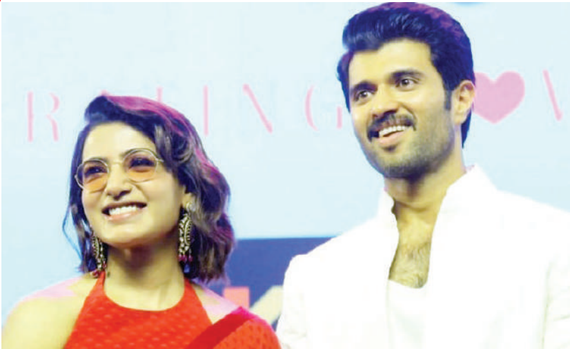
ವೃತ್ತಿರಂಗದಲ್ಲಿ ಬ್ಯುಸಿಯಾದರು.'ಪುಷ್ಪ' ಚಿತ್ರದಲ್ಲಿ ಸೊಂಟ ಬಳುಕಿಸಿದ ಮೇಲೆ ಸಮಂತಾ ಲಕ್ ಬದಲಾಯ್ತು. ಆದರೆ ಯಶೋದ ಮತ್ತು ಮಿಷಿ ಸಿನಿಮಾ ಆರೈಲೆ ಬಿಗ್ ಸ್ಕ್ರೀನ್ ಮೇಲೆ ಕಾಣಿಸಿಕೊಂಡಿರಲಿಲ್ಲ. ಎರಡೂ ಹೀನಾಯವಾಗಿ ಸೋತ ಚಿತ್ರಗಳು. ಸೋಲಿನ ಹೊಡೆತಕ್ಕೆ ಅನಾರೋಗ್ಯದ ಆಘಾತ ಎರಡನ್ನೂ ಸಹಿಸಿಕೊಳ್ಳೋಕೆ ಸ್ಟಾರ್ಮ್‌ಗೆ 8 ತಿಂಗಳು ಹಿಡಿಯಿತು.ಇದೀಗ ಮತ್ತೆ ಕೆಲಸಕ್ಕೆ ಮರಳಿದ್ದಾರೆ. ವರುಣ್ ಧವನ್‌ಗೆ ನಾಯಕಿಯಾಗಿ ಬಾಲಿವುಡ್ ಗೆ ಪಾದಾರ್ಪಣೆ ಮಾಡಿದ್ದಾರೆ. ಹನಿ ಬನಿ ಮೂಲಕ ನಟಿ ಅದ್ವೈ ಪರೀಕ್ಷೆಗಿಳಿದಿದ್ದಾರೆ.

ಟಾಲಿವುಡ್ ನಟಿ ಸಮಂತಾ ತಮ್ಮ ಹುಟ್ಟುಹಬ್ಬದ ಸೆಲೆಬ್ರೇಶನ್ ಮೂಡ್ ನಲ್ಲಿವಾರೆ. ತೆಲುಗಿನ ಆಪ್ ಬ್ಯಾಟ ಸ್ಟಾರ್ಮ್ಗೆ ಹಲವು ನಟ-ನಟಿಯರು ಬರ್ತ್‌ಡೇಗೆ ವಿಶೇಷವಾಗಿ ಶುಭಕೋರಿದ್ದಾರೆ. ಇದೀಗ ವಿಜಯಾ ದೇವರಕೊಂಡ ತಮ್ಮ ಸಹ ನಟಿ ಸಮಂತಾಗೆ ಸ್ವೀಟ್ ಆಗಿ ವಿಶ್ ಮಾಡಿದ್ದಾರೆ. ಹ್ಯಾಪಿ ಬರ್ತ್‌ಡೇ ಸಾಮಿ, ಸದಾ ಖುಷಿಯಾಗಿರಿ ಮತ್ತು ಆರೋಗ್ಯವಾಗಿರಿ ಎಂದು ವಿಜಯಾ ವಿಶೇಷವಾಗಿ ನಟಿಗೆ ಶುಭಕೋರಿದ್ದಾರೆ. 'ಮಿಷಿ' ಸಿನಿಮಾ ಪ್ರೀ- ರಿಲೀಸ್ ಕಾರ್ಯಕ್ರಮದಲ್ಲಿ ಸಮಂತಾ ಜೊತೆ ಆಶ್ರೀಯವಾಗಿದ್ದ ಪೋಟೋಗಳನ್ನು ಶೇರ್ ಮಾಡಿ ಶುಭಹಾರೈಸಿದ್ದಾರೆ. ವಿಜಯಾ ಪೋಸ್ಟ್‌ಗೆ ಸ್ಟಾರ್ಮ್ ಕೂಡ ರಿಯಾಕ್ಟ್ ಮಾಡಿ, ಧನ್ಯವಾದ ತಿಳಿಸಿದ್ದಾರೆ. ಅಂದಹಾಗೆ, ವಿವಾದ, ಅನಾರೋಗ್ಯ, ಯಶಸ್ಸು ಎಲ್ಲವೂ ಅನುಭವಿಸಿರುವ ಜೀವ ಸಮಂತಾ.ನಾಗಚೈತನ್ ಜೊತೆಗಿನ ದಾಂಪತ್ಯಕ್ಕೆ ಅಂತ್ಯ ಹಾಡಿದ ಮೇಲೆ ಸಮಂತಾ ಸಾಕಷ್ಟು ಟೀಕೆಗಳಿಗೆ ಗುರಿಯಾಗಿದ್ದರು.ಎಲ್ಲಾ ವಿಚಾರಕ್ಕೂ ಸಮಂತಾ ಕಡೆಯೇ ಬೆಟ್ಟು ಮಾಡಿ ತೋರಿಸುತ್ತಿದ್ದರು.ಸಹವಾಸವೇ ಬೇಡ ಅಂತ