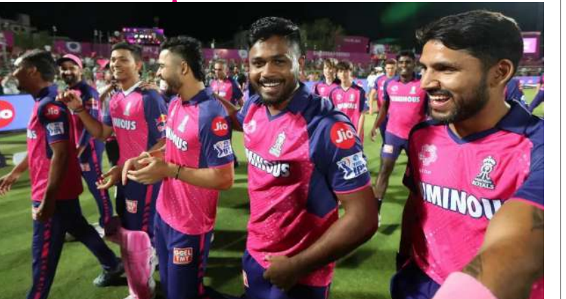
ಸಾಧಿಸಿದರೆ ಒಟ್ಟು 20 ಅಂಕಗಳೊಂದಿಗೆ ಪ್ಲೇಆಫ್ ಗೆ ಪ್ರವೇಶಿಸಬಹುದು. ಹಾಗೆಯೇ 10 ಅಂಕಗಳನ್ನು ಹೊಂದಿರುವ ಸಿಎಸ್ ಕೆ ತಂಡ ಮುಂದಿನ 5 ಪಂದ್ಯಗಳಲ್ಲೂ ಜಯ ಸಾಧಿಸಿ 20 ಪಾಯಿಂಟ್ಸ್ ನೊಂದಿಗೆ ಪ್ಲೇಆಫ್ ಗೆ ಅರ್ಹತೆ ಗಿಟ್ಟಿಸಿಕೊಳ್ಳಬಹುದು. ಅದೇ ರೀತಿ ಸನ್ ರೈಸರ್ಸ್ ಹೈದರಾಬಾದ್ ಹಾಗೂ ಲಕ್ನೋ ಸೂಪರ್ ಜೈಂಟ್ಸ್ ತಂಡಗಳಿಗೂ ಮುಂದಿನ 5 ಪಂದ್ಯಗಳಲ್ಲಿ ಜಯ ಸಾಧಿಸಿ 20 ಅಂಕಗಳನ್ನು ಗಳಿಸಲು ಉತ್ತಮ ಅವಕಾಶವಿದೆ.

ಈ ಬಾರಿಯ ಐಪಿಎಲ್‌ನಲ್ಲಿ ಆಡಿರುವ 9 ಕ್ಷೇಪಂದ್ಯಗಳಲ್ಲಿ 8 ಜಯ ಸಾಧಿಸಿರುವ ರಾಜಸ್ಥಾನ್ ರಾಯಲ್ಸ್ ತಂಡವು ಅಂಕ ಪಟ್ಟಿಯಲ್ಲಿ ಅಗ್ರಸ್ಥಾನದಲ್ಲಿದೆ. ಇದಾಗ್ಯೂ ಸಂಬ ಸ್ಕಾಮ್ಸ್ ಪಡೆ ಪ್ಲೇಆಫ್ ಪ್ರವೇಶವನ್ನು ಖಚಿತಪಡಿಸಿಕೊಂಡಿಲ್ಲ ಎಂಬುದು ವಿಶೇಷ. ಅಂದರೆ ರಾಜಸ್ಥಾನ್ ರಾಯಲ್ಸ್ ತಂಡದ ಪ್ಲೇಆಫ್ ಗೆ ನೇರ ಅರ್ಹತೆ ಪಡೆಯಲು ಇನ್ನೆರಡು ಪಂದ್ಯಗಳನ್ನು ಗೆಲ್ಲಬೇಕಿದೆ. ಆರ್ ಸಿಬಿ ತಂಡವನ್ನು ಹೊರತುಪಡಿಸಿ ಉಳಿದಲ್ಲಾ ತಂಡಗಳಿಗೂ 16 ಅಂಕಗಳನ್ನು ಗಳಿಸುವ ಅವಕಾಶವಿದೆ. ಹೀಗಾಗಿ ಪ್ರಸ್ತುತ 16 ಅಂಕಗಳನ್ನು ಹೊಂದಿರುವ ಆರ್ ಆರ್ ತಂಡವು ಮುಂದಿನ ಪಂದ್ಯದಲ್ಲಿ ಗೆದ್ದು ಪ್ಲೇಆಫ್ ಪ್ರವೇಶಿಸುವನ್ನು ಬಹುತೇಕ ಖಚಿತಪಡಿಸಿಕೊಳ್ಳಬಹುದು. ಹಾಗೆಯೇ ಮುಂದಿನ 5 ಪಂದ್ಯಗಳಲ್ಲಿ 2 ಮ್ಯಾಚ್ ಗಳನ್ನು ರಾಜಸ್ಥಾನ್ ರಾಯಲ್ಸ್ ತಂಡ ಗೆದ್ದರೆ ಪ್ಲೇಆಫ್ ಗೆ ಅಧಿಕೃತವಾಗಿ ಅರ್ಹತೆ ಪಡೆಯಲಿದೆ. ಹೀಗಾಗಿ ರಾಜಸ್ಥಾನ್ ರಾಯಲ್ಸ್ ತಂಡವು ಸನ್ ರೈಸರ್ಸ್ ಹೈದರಾಬಾದ್ ಮತ್ತು ಡೆಲ್ಲಿ ಕ್ಯಾಪಿಟಲ್ಸ್ ವಿರುದ್ಧ ಗೆಲ್ಲುವ ಮೂಲಕ ಆರ್ ಆರ್ ಪ್ಲೇಆಫ್ ಗೆ ಪ್ರವೇಶಿಸುವ ವಿಶ್ವಾಸದಲ್ಲಿದೆ. ಇನ್ನು 8 ಪಂದ್ಯಗಳಲ್ಲಿ 10 ಅಂಕ ಪಡೆದಿರುವ ಕೆಕೆಆರ್ ಮುಂದಿನ 6 ಪಂದ್ಯಗಳಲ್ಲಿ 5 ಜಯ ಸಾಧಿಸಿದರೆ ಒಟ್ಟು 20 ಅಂಕಗಳೊಂದಿಗೆ ಪ್ಲೇಆಫ್ ಗೆ ಪ್ರವೇಶಿಸಬಹುದು. ಹಾಗೆಯೇ 10 ಅಂಕಗಳನ್ನು ಹೊಂದಿರುವ ಸಿಎಸ್ ಕೆ ತಂಡ ಮುಂದಿನ 5 ಪಂದ್ಯಗಳಲ್ಲೂ ಜಯ ಸಾಧಿಸಿ 20 ಪಾಯಿಂಟ್ಸ್ ನೊಂದಿಗೆ ಪ್ಲೇಆಫ್ ಗೆ ಅರ್ಹತೆ ಗಿಟ್ಟಿಸಿಕೊಳ್ಳಬಹುದು. ಅದೇ ರೀತಿ ಸನ್ ರೈಸರ್ಸ್ ಹೈದರಾಬಾದ್ ಹಾಗೂ ಲಕ್ನೋ ಸೂಪರ್ ಜೈಂಟ್ಸ್ ತಂಡಗಳಿಗೂ ಮುಂದಿನ 5 ಪಂದ್ಯಗಳಲ್ಲಿ ಜಯ ಸಾಧಿಸಿ 20 ಅಂಕಗಳನ್ನು ಗಳಿಸಲು ಉತ್ತಮ ಅವಕಾಶವಿದೆ.